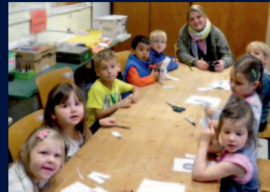
Kindergartengruppe beim Bau des Planeten-Modellsystems