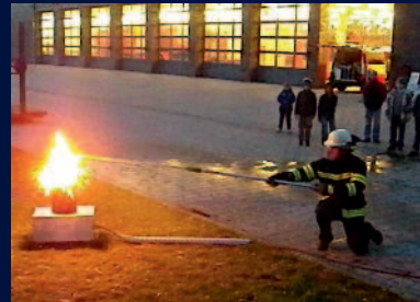
Besuch bei der Feuerwehr: Löschen einer Fettpfanne