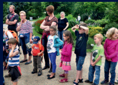
Andrang beim NAWI-Stand im Park der Gärten/Rostrup

Das Programm des NAWI-Hauses ist zu finden unter: www.nawi-haus.de Träger des NAWI-Hauses: Verband Christlicher Lehrer & Lehrerinnen e.V.