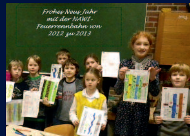
Jahresabschluss: Bau einer Feuer- rennbahn für die Silvesterfeier